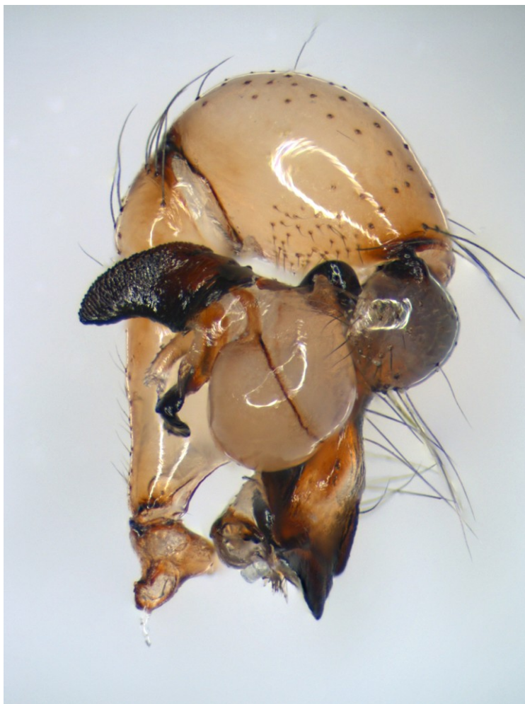
3. ábra: A nagy álkaszpók ( Pholcus phalangioides ) hímjének tapogatólába oldalnézeten. Figure 3. The palp of males Pholcus phalangioides (retrolateral view).

Testméret: a nőstények fejtorának hossza 2,5 - 3 mm, míg a hímeké 2,6 mm, teljes testhosszuk 8-10 mm. Hosszú lábaikkal együtt 60-70 mm-es méretet is elérhetnek (HERMAN 1879, LOKSA 1969, KENYERES 1997). A Kárpát-medencében előforduló többi álkaszpók fajtól elsősorban jelentős mérete és feltűnő mintázat nélküli teste különbözteti meg (SZINETÁR 2006). Mind a hím, mind a nőstény alapszíne szürke, enyhe barnás árnyalattal (LOKSA 1969). Élettartama maximálisan 3 év.