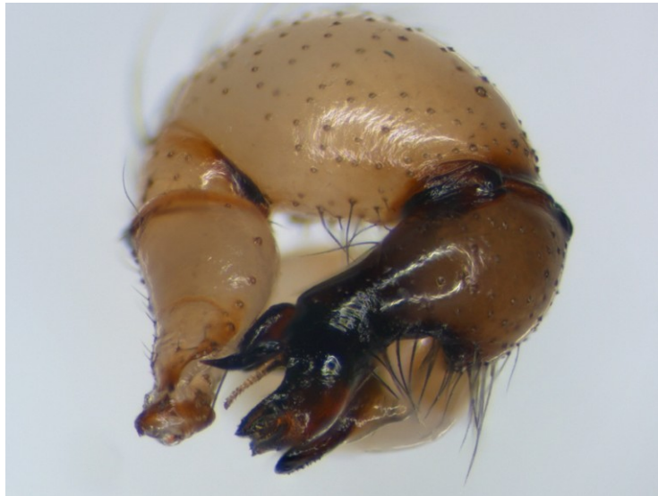
1. ábra: A mintás álkaszápók ( Hoplopholcus forskali ) hímjének tapogatólába oldalnézetben. Figure 1. The palp of males Hoplopholcus forskali (retrolateral view).

Testméret: a nőstények fejtorának hossza 2,5 - 3 mm, míg a hímeké 2 mm (HERMAN 1879, LOKSA 1969, 1984). Mind a hím, mind a nőstény világos sárgásszürke színű (LOKSA 1969).