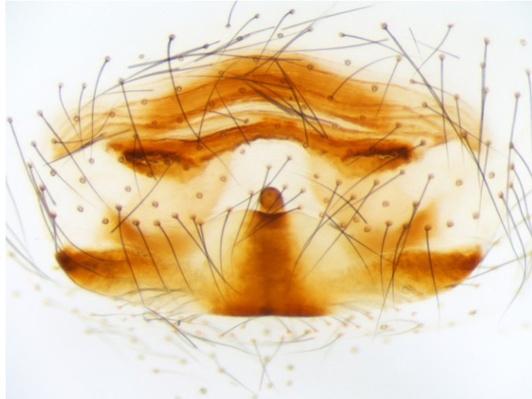
4. ábra: A nagy álkaszápók ( Pholcus phalangioides ) nőtényének vulvája felülnézetben. Figure 4. The vulva of females Pholcus phalangioides (dorsal view).